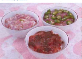
9.まぐろ丼セット 冷凍