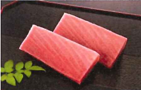
5.めばち中とろサク 冷凍

天然本まぐろの天身をサク状にしました。鮮紅色が食卓を華やかにします。刺身はもちろん漬けも美味。(日本船/大西洋産)