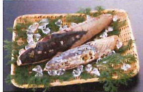
6.かつおたたき 冷凍

メバチまぐろの中とろサクです。刺身はもちろん、丼、手巻き寿司等に！(日本船/太平洋または大西洋産)