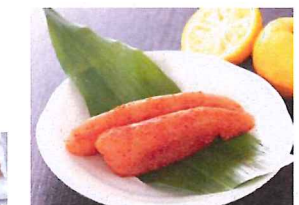
12.辛子明太子(柚子風味) 冷凍

お刺身用に下処理した平目です。刺身の盛り合わせ、手巻き、海鮮丼、カルパッチョに。(三重/養殖)