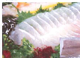
11.刺身用 平目 冷凍

お刺身用に下処理したかんばちです。刺身の盛り合わせ、手巻き、海鮮丼に。(鹿児島・宮崎/養殖)