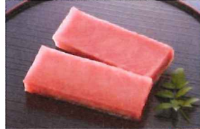
2.南まぐろ赤身サク 冷凍

天然の南まぐろのカワラ部分をサク状にしました。南鯨ならではの甘みをお楽しみ下さい。(日本船/インド洋産)