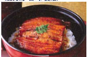
14.鹿児島産うなぎ蒲焼 冷凍

オホーツク海産のホタテ貝柱。刺身はもちろんソテーにも。3Sサイズ(41~50粒入)