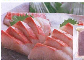
10.刺身用 かんばち 冷凍

とろろ青のり風味70g、旨塩おくら80g、生七味昆布70g 各4パックのまぐろ丼セット。サラダのトッピング、パスタ等にも！