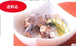
16.いわしレモン煮 缶詰 常温

金目鯛、銀だら、銀鮭、メロの切身を西京味噌に40時間以上漬け込み、旨味を最大限に引き出しました。化粧箱入。メーカー直送