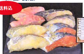
15.西京漬けセット 冷凍

鹿児島島の豊かな湧水で育ったうなぎをふっくら柔らかくに焼き上げました。2袋入り。今年の土用の丑は7月27日です。