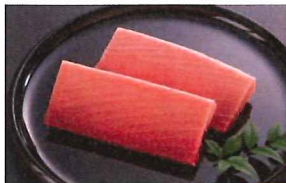
1.南まぐろ中とろサク 冷凍