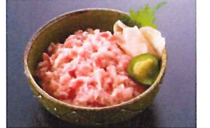
8.本鯨ネギトロ用 冷凍

一本釣りがつお船が太平洋で漁獲した下りかつお(戻りかつお)です。静岡県焼津港水揚げ。(日本船)