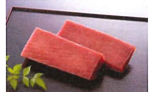
4.本まぐろ赤身サク 冷凍

天然の本まぐろのカワラ部分をサク状にしました。深みのある旨味をお楽しみ下さい。(日本船/大西洋産)